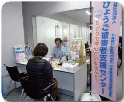
犯罪被害者支援・ホンデリング窓口の様子